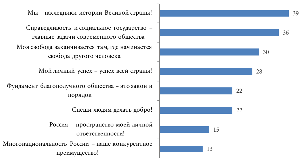
Рис. 5. Распределение ответов на вопрос: «Какие ценности и смыслы, на Ваш взгляд, распространены в молодежной среде Крыма прежде всего?», %, выбор не более 3-х вариантов ответа

Для понимания ценностно-смысловой конструкции сознания крымской молодёжи исследовалась популярность определённых ценностных смыслов. Показательным стало то, что максимальный вес набрала патриотическая смысловая установка «Мы – наследники истории великой страны!» (39%). Треть опрошенных молодых людей выбрали утверждение о социальной справедливости («Справедливость и социальное государство – главные задачи современного общества» – 36%) и о соотношении личной и общественной свобод («Моя свобода заканчивается там, где начинается свобода другого человека» – 30%). Ценность личного и общественного успеха («Мой личный успех – успех всей страны!») популярна у 28% опрошенных. Необходимость закона и порядка как основ общества осознают 22% респондентов («Фундамент благополучного общества – это закон и порядок»). В рамках нашего исследовательского интереса важным оказалось то, что утверждение «Многонациональность России – наше конкурентное преимущество!» не получило поддержки у большинства опрошенных (13%), что свидетельствует о слабости этнического фактора при формировании смысловых принципов крымской молодёжи (см. рис. 5).