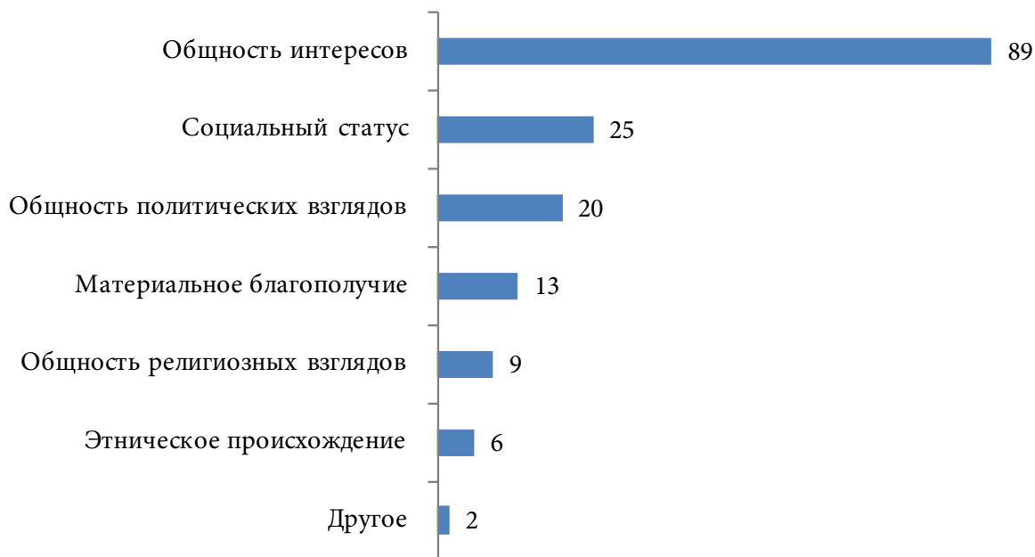
Рис. 4. Распределение ответов на вопрос: «Оценивая личность человека в целом, на какие характеристики Вы обращаете внимание прежде всего?», %, выбор не более 3-х вариантов ответа