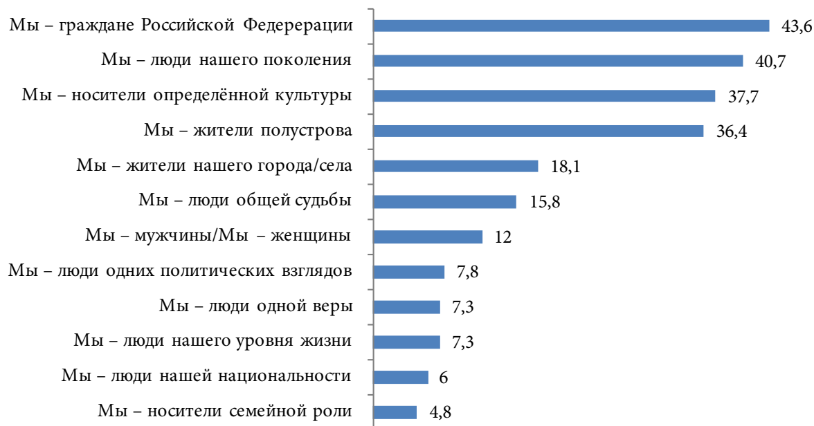
Рис. 1. Распределение ответов на вопрос: «Какие из перечисленных ниже групп наиболее близкие Вам по духу?», %

Fig. 1. Distribution of answers to the question