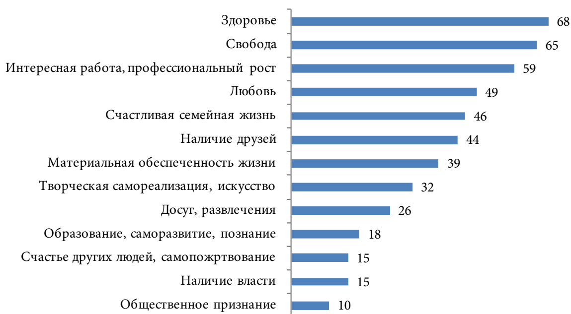
Рис. 2. Распределение ответов на вопрос: «Насколько важны для Вас следующие ценности?», % Fig. 2. Distribution of answers to the question «How important are the following values for you?», %