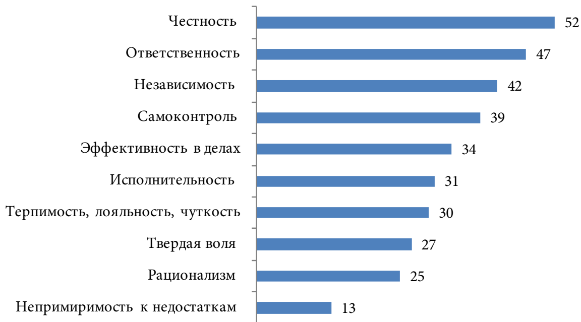
Рис. 3. Распределение ответов на вопрос: «Насколько важны для Вас следующие качества?», % Fig. 3. Distribution of answers to the question «How important are the following qualities for you? », %

Оценивая актуальные личностные качества в национальных группах, мы выяснили, что независимость в большей степени ценят украинцы, а эффективность – русские и крымские татары (см. таблицу 3).