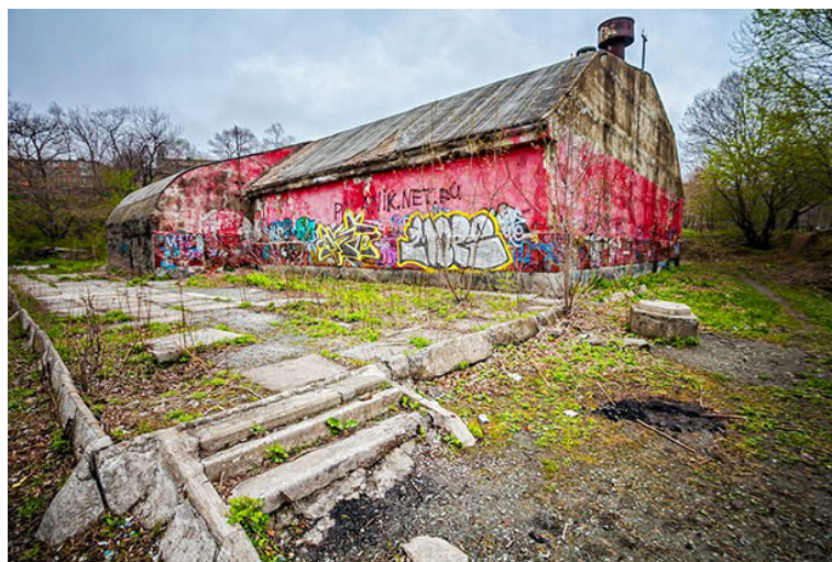
Рис. 6. Парк «Минный городок»

Парк «Минный городок» большинство информантов – родителей, принявших участие в нашем исследовании, – определяют как опасное место для детей