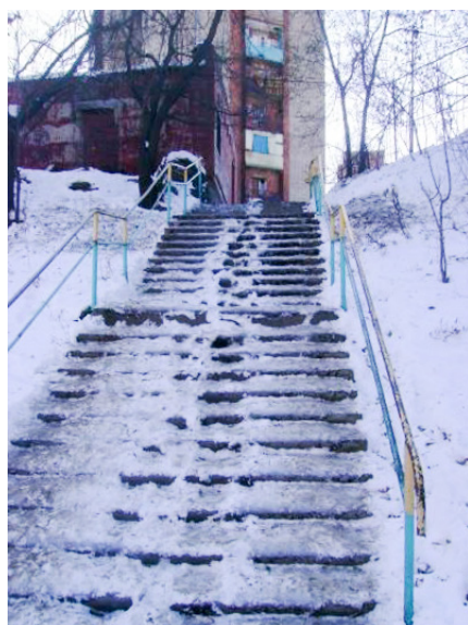
Рис. 3. Лестница в одном из дворов Владивостока

На рис. 3 изображена длинная лестница – обычное явление Владивостока. В зимнее время года подъём затрудняется образовавшимися на ступенях снежными накатами.