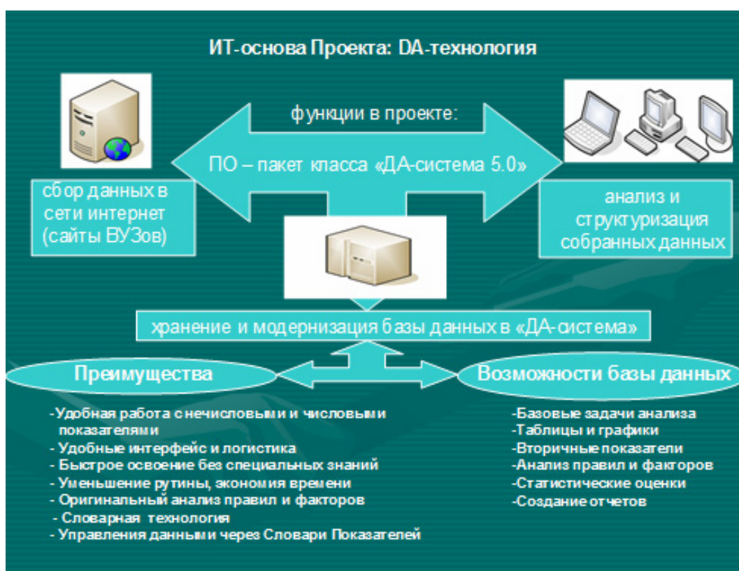
Рис. 1. ИТ-основа проекта исследования

Работа строилась в контексте разработки новых методов анализа агрегированной онлайн-информации и новых подходов к контент-анализу символических репрезентаций [Ракитов, Бондяев 2009]. На стадии формирования методического инструментария и ИТ-основы для обследования в интерактивном режиме текстов авторефератов диссертационных работ была разработана схема сбора, анализа и хранения данных (см. рис. 1).