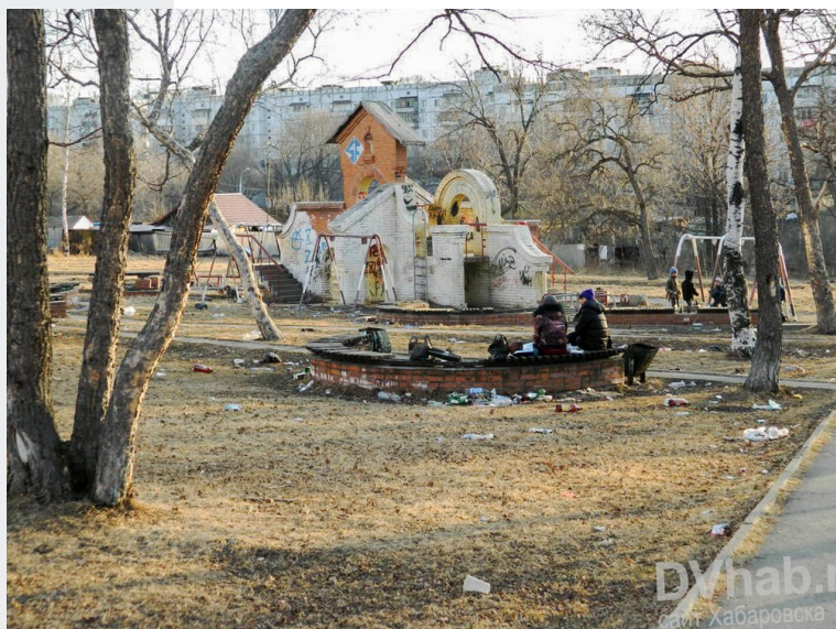
Рис. 5. Парк «Берёзовая роща»

Владивостоке, хотя ухоженные скверы и парки сосредоточены в центре города, а на периферии всё значительно хуже. В кейсах Хабаровска и Владивостока можно выделить две похожие истории постепенного запустения, загрязнения и разрушения двух парков. К сожалению, это не единственные примеры городских жертв перехода страны к рыночной экономике. Во Владивостоке – это уже упоминавшийся парк «Минный городок»,