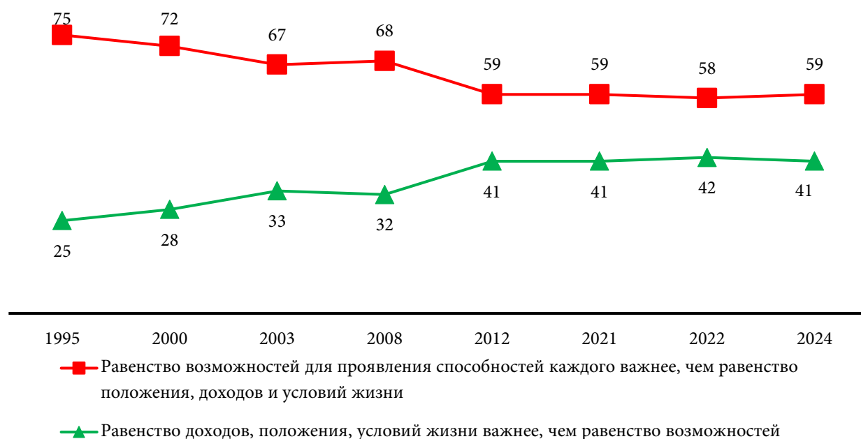
Рис. 3. Динамика выбора в дилемме «равенство возможностей – равенство доходов», 1995–2024 гг., %

трактуют рост интереса граждан к равенству доходов как следствие их разочарования и в актуальных «правилах игры» [16], не способствующих созданию справедливых неравенств, и в реализуемости стратегии национального развития, основанной на человеческом капитале.