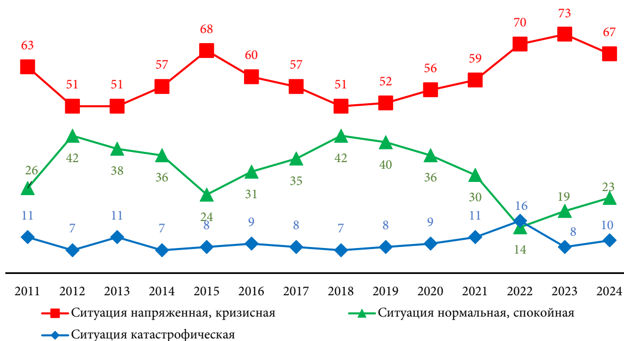
Рис. 1. Динамика оценок россиянами ситуации в стране, 2011–2024 гг., %

Figure 1. Dynamics of Russians' perceptions of the situation in the state, 2011–2024, %